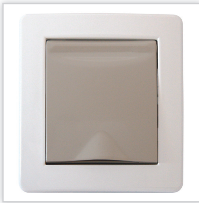
De Luxe BASE. Wysokiej jakości o nowoczesnym designie seria gniazd do odkurzania centralnego marki Efapel (Aspilusa). Model BASE to pełnia podstawowych kolorów z możliwością aranżacji gniazdo-plytka.