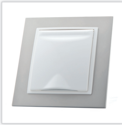
De Luxe Metallo. Bardzo zgrabna, smukła, o cienkich solidnych metalowych lub szklanych ściankach seria gniazd do odkurzania centralnego marki Efapel (Aspilusa). Modele Exclusive to bezkompromisowa solidność oraz desing dla każdego.