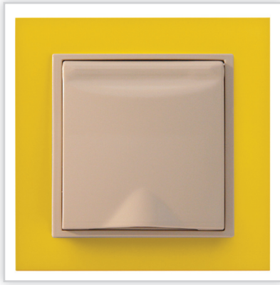
De Luxe ANIMATO. Bardzo zgrabna, smukła o cienkich ściankach seria gniazd do odkurzania centralnego marki Efapel (Aspilusa). Model Animato to szeroka paleta żywych kolorów idealna do każdego wnętrza.