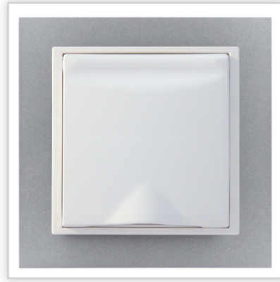
De Luxe ANIMATO. Bardzo zgrabna, smukła o cienkich ściankach seria gniazd do odkurzania centralnego marki Efapel (Aspilusa). Model Animato to szeroka paleta żywych kolorów idealna do każdego wnętrza.