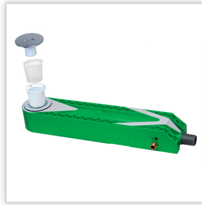
Zypho to rekuperator, który przekazuje ciepło z wody z prysznica, na zimną, która przechodząc przez rekuperator dochodzi do baterii prysznica wstępnie ogrzana, znacznie redukując ilość energii potrzebnej do podgrzania lub pobór ciepłej wody. ZYPHO ogrzewa wodę na zasadzie pracy bierniej, urządzenie nie potrzebuje kompletnie żadnego zasilania ani jakiegokolwiek energii, a zwrot inwestycji następuje po 2-3 latach.