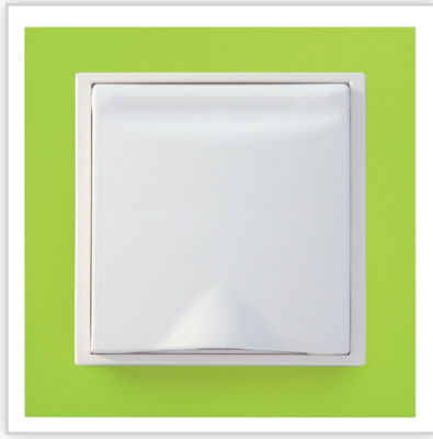
De Luxe ANIMATO. Bardzo zgrabna, smukła o cienkich ściankach seria gniazd do odkurzania centralnego marki Efapel (Aspilusa). Model Animato to szeroka paleta żywych kolorów idealna do każdego wnętrza.