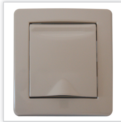
De Luxe BASE. Wysokiej jakości o nowoczesnym designie seria gniazd do odkurzania centralnego marki Efapel (Aspilusa). Model BASE to pełnia podstawowych kolorów z możliwością aranżacji gniazdo-plytka.