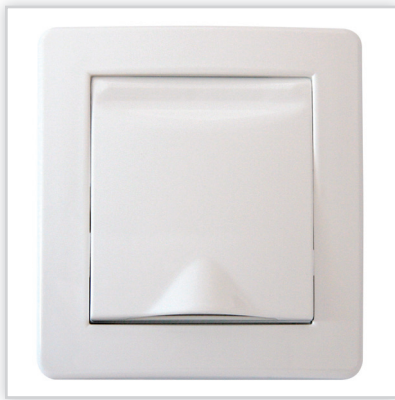
De Luxe BASE. Wysokiej jakości o nowoczesnym designie seria gniazd do odkurzania centralnego marki Efapel (Aspilusa). Model BASE to pełnia podstawowych kolorów z możliwością aranżacji gniazdo-plytka.